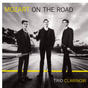
"Mozart On The Road"